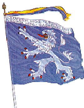
Kungl. Hallands regementes fana

På regementsfanan finns segernamnen från slagen vid Lützen 1632 , Leipzig 1642, Lund 1676 och Gadebusch 1712.